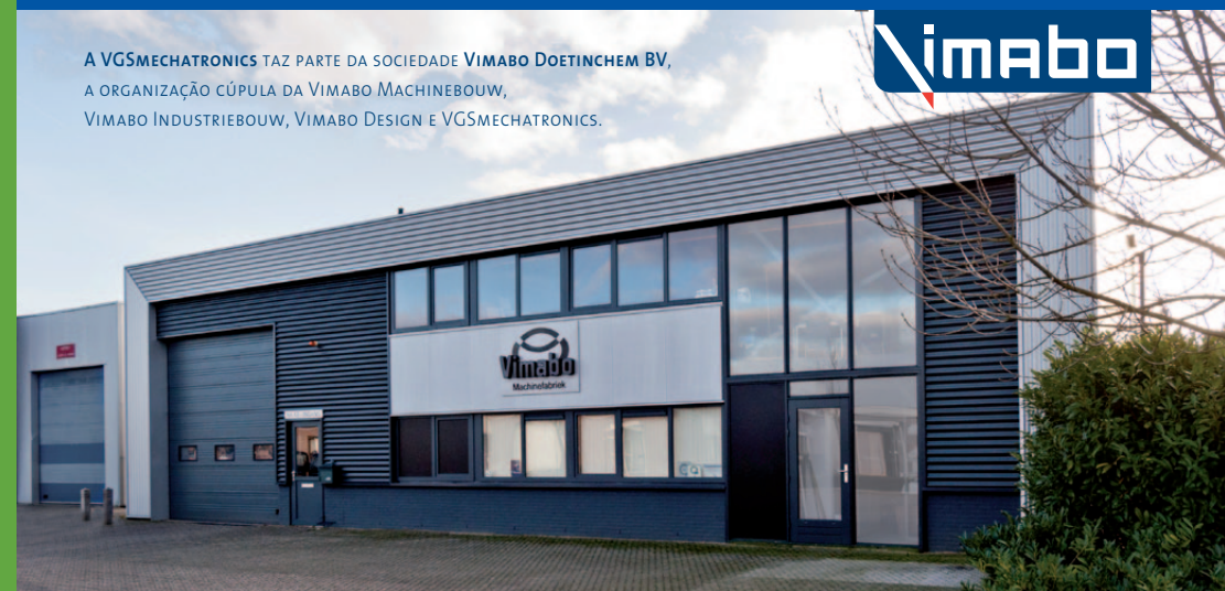
A VGSMECHATRONICS TAZ PARTE DA SOCIEDADE VIMABO DOETINCHEM BV, A ORGANIZAÇÃO CÚPULA DA VIMABO MACHINEBOUW, VIMABO INDUSTRIEBOUW, VIMABO DESIGN E VGSMECHATRONICS.